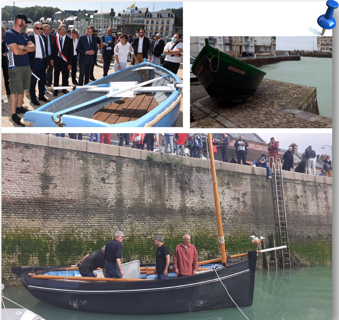
Visite de la ministre de la mer – Exposition des Doris sur le port – Mise à l'eau de Marie-Madeleine

Durant l'été, les deux doris (embarcations traditionnelles de terre-neuvas) ont été exposés sur le port de St Valery en Caux, avec une fiche explicative de leur histoire.