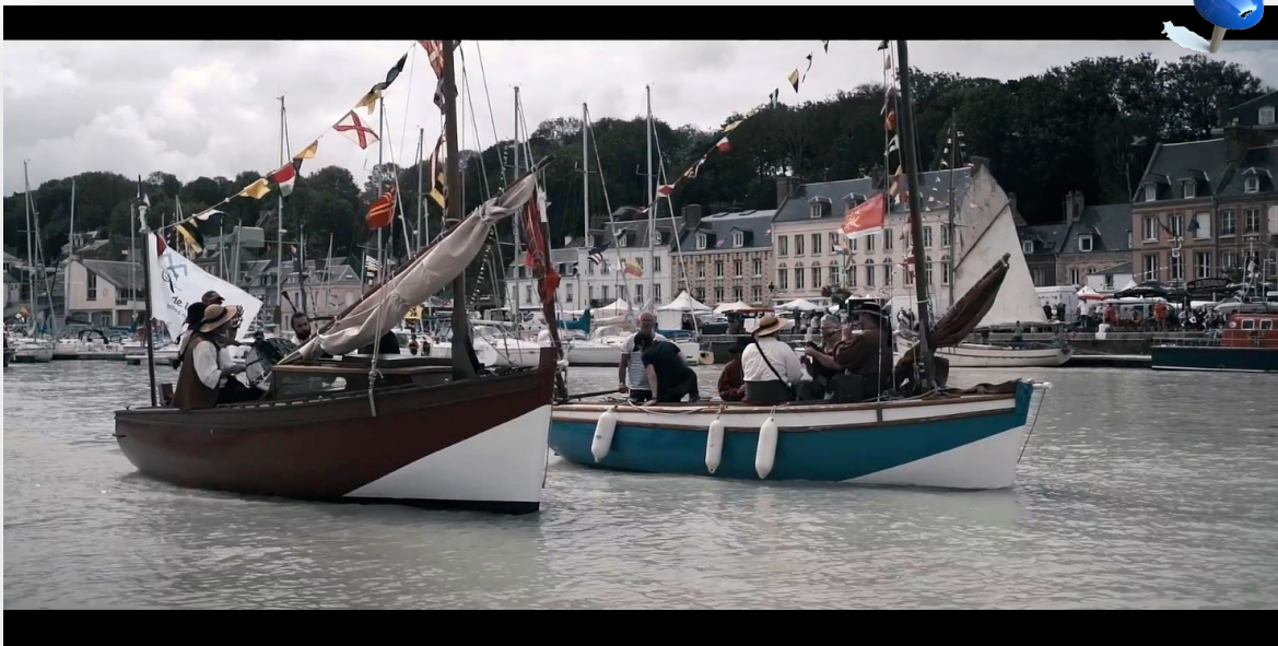
Parade avec la troupe de musique traditionnelle bretonne (Banda tchok)

La participation à la fête de la mer en août 2020 a été le premier événement de l'association. Dans le contexte sanitaire, nous avons néanmoins pu proposer des balades au public avec les courlis. On a innové en proposant à une troupe de musique traditionnelle de monter à bord des deux courlis pour réaliser une parade dans le port. Succès garanti.